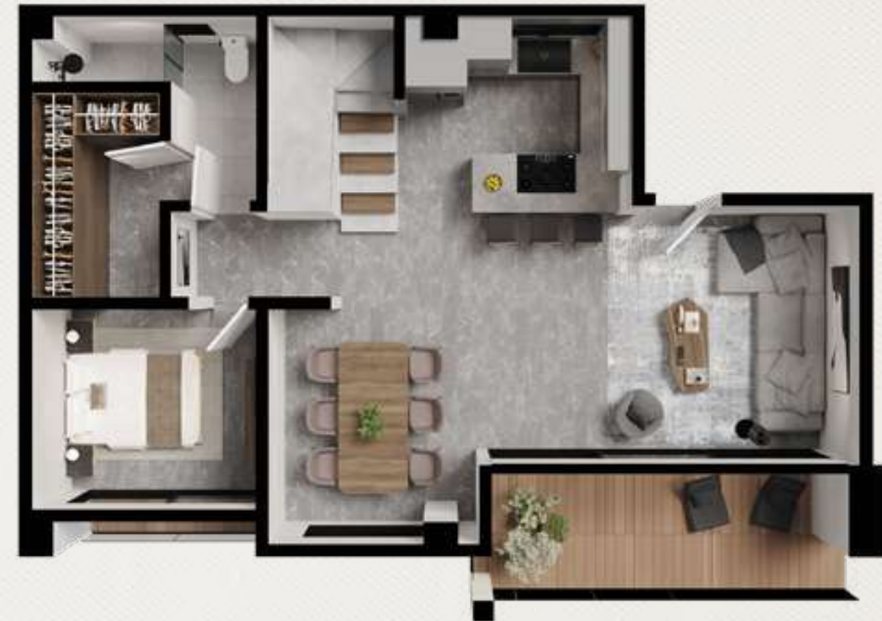
PLANTA BAJA 80.50 m 2 BALCÓN 11.55 m 2