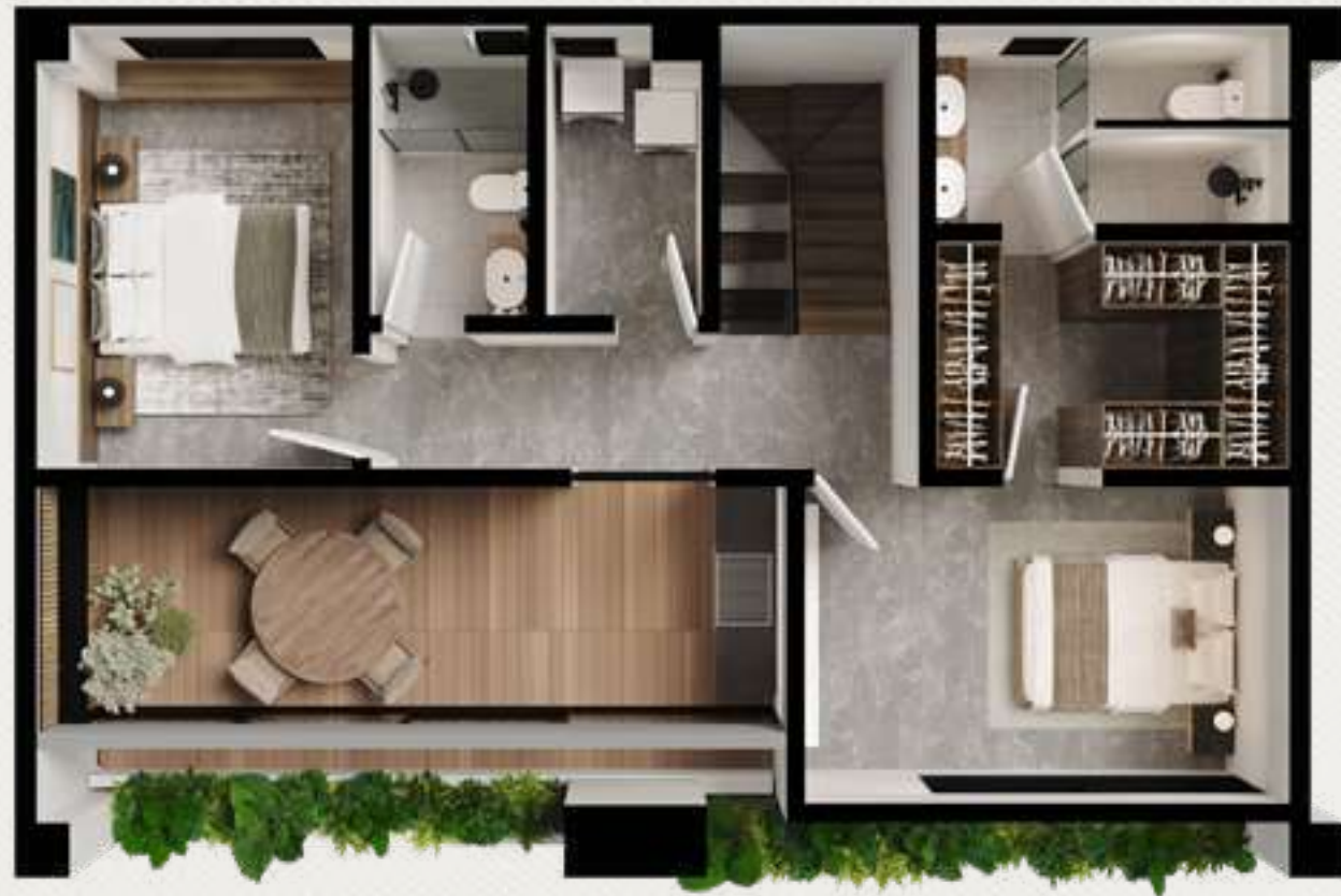
PLANTA ALTA 67.82 m 2 ROOF GARDEN 24.98 m 2