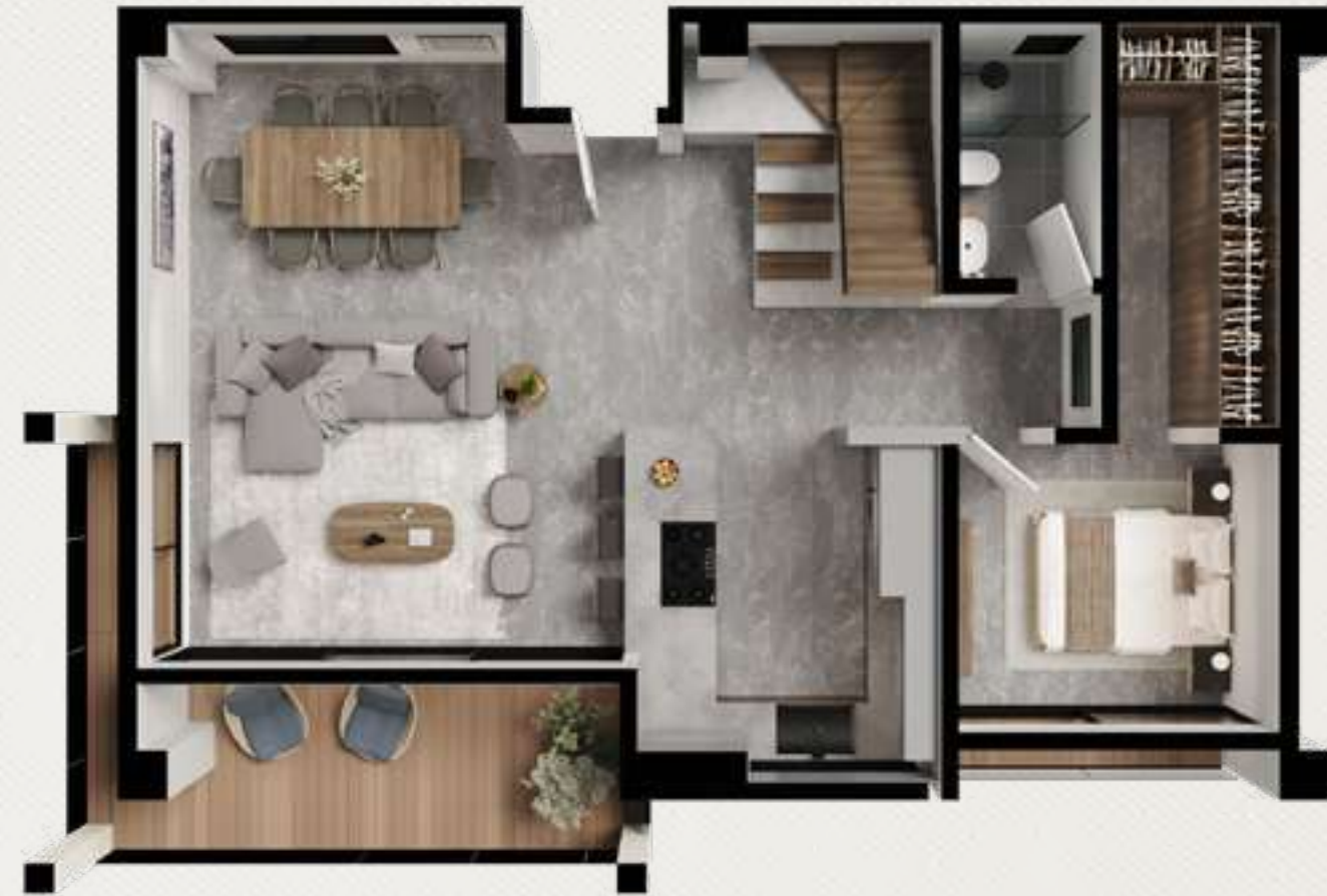
PLANTA BAJA 85.32 m 2 BALCÓN 14.98 m 2