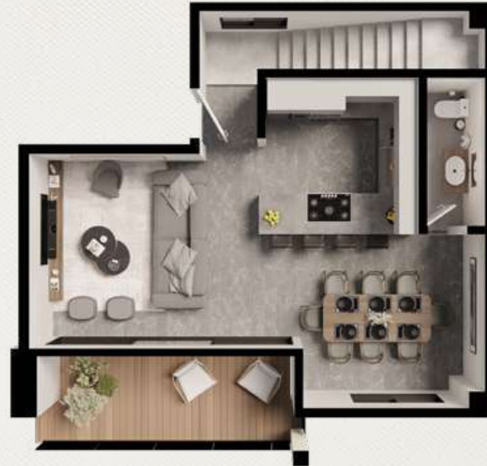
PLANTA BAJA 56.39 m 2 BALCÓN 11.55 m 2