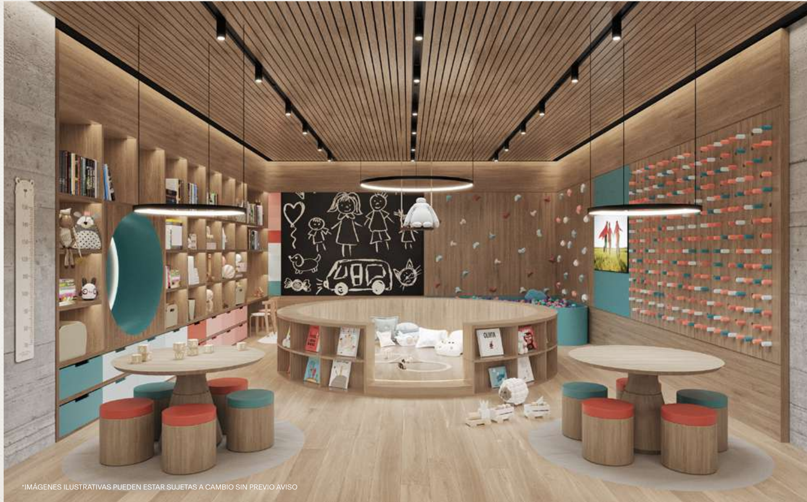
*IMÁGENES ILUSTRATIVAS PUEDEN ESTAR SUJETAS A CAMBIO SIN PREVIO AVISO