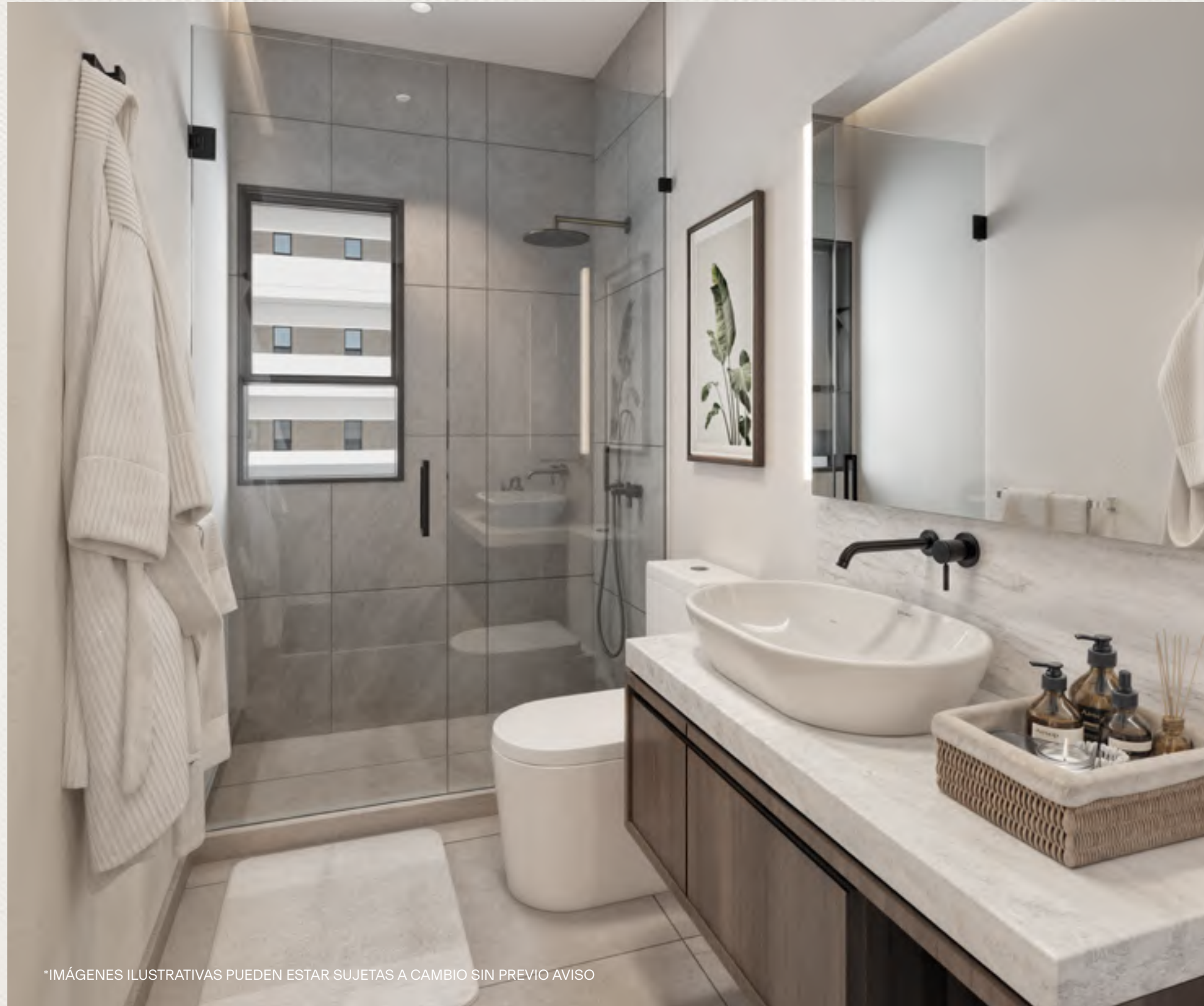
*IMÁGENES ILUSTRATIVAS PUEDEN ESTAR SUJETAS A CAMBIO SIN PREVIO AVISO