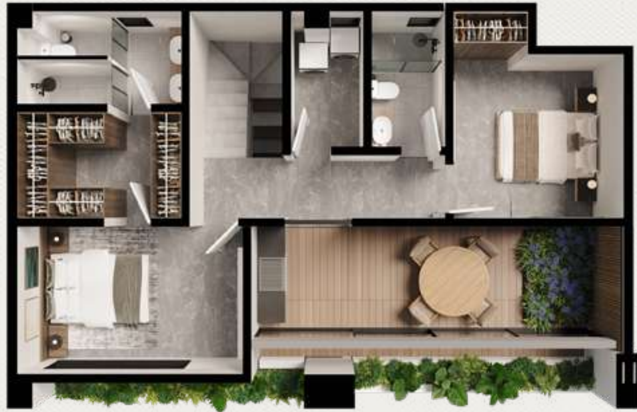
PLANTA ALTA 67.73 m 2 BALCÓN 26.23 m 2