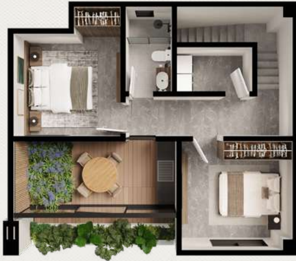
PLANTA ALTA 50.76 m 2 ROOF GARDEN 19.09 m 2