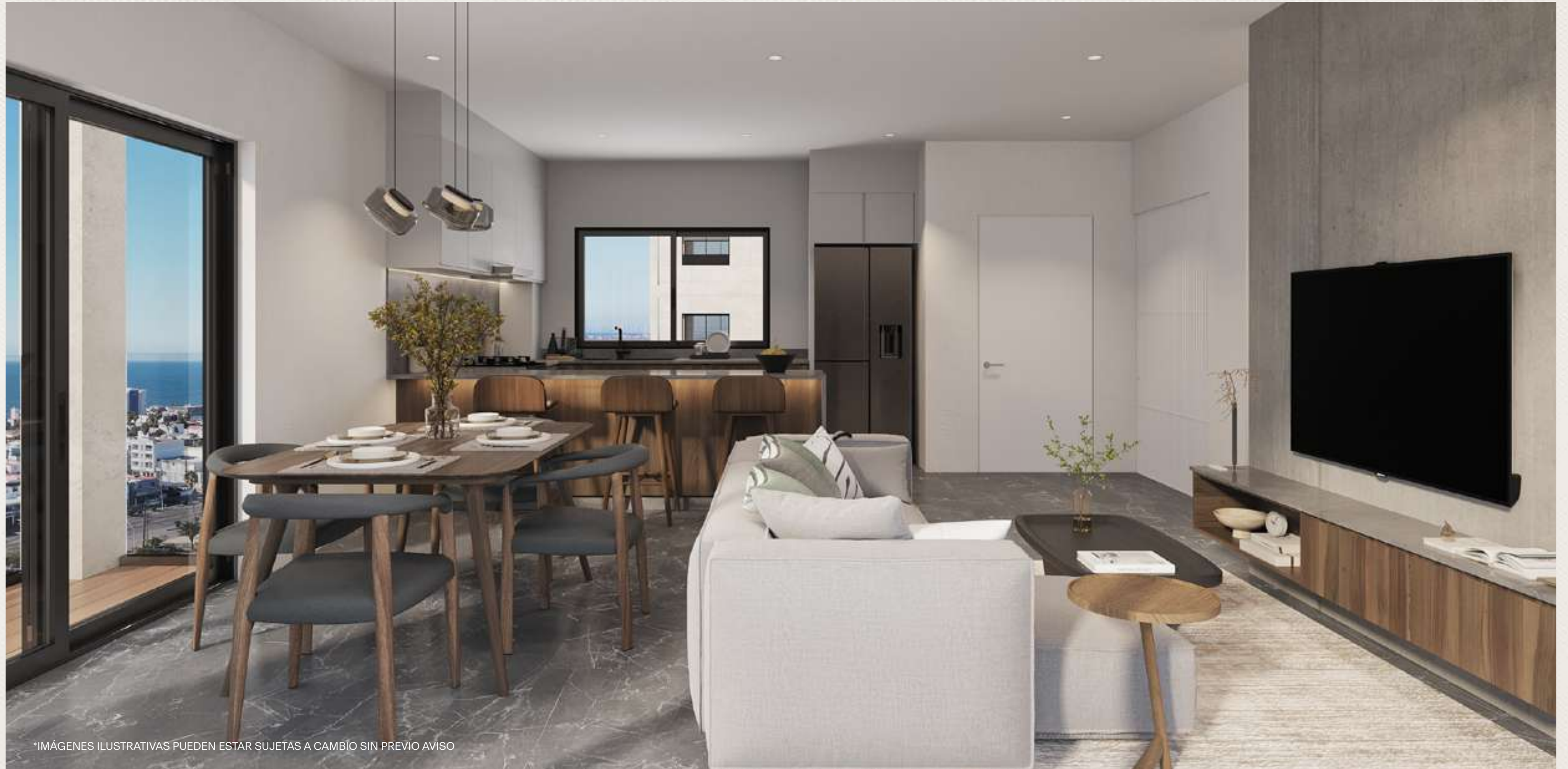
*IMÁGENES ILUSTRATIVAS PUEDEN ESTAR SUJETAS A CAMBIO SIN PREVIO AVISO